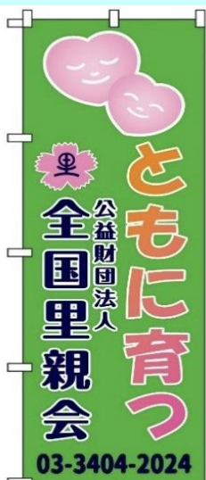
幟旗 (ポールセット)