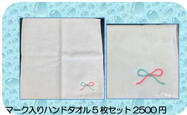
マーク入りハンドタオル5枚セット 2500円