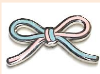
フォスタリング バッジ 500円