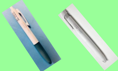
マーク入りボールペン 250円