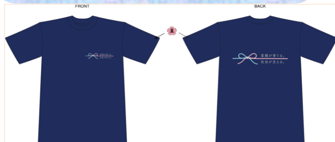
フォスタリングマーク入りTシャツ S～LLサイズ 3,000円