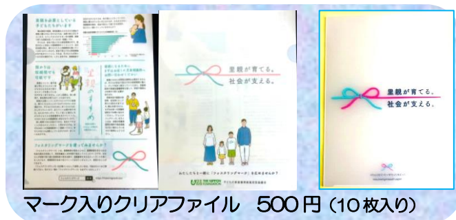
マーク入りクリアファイル 500円(10枚入り)