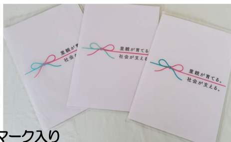
マーク入り クリアファイル 500円 (10枚入り)