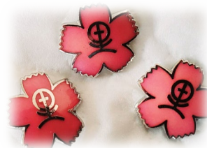
全国里親会バッジ 500円