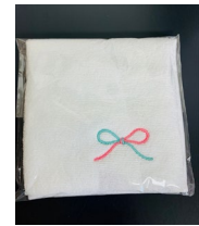
マーク入りハンドタオル5枚セット 2500円