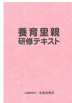
養育里親 研修テキスト 1000円