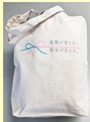
マーク入り バッグ 1,500円