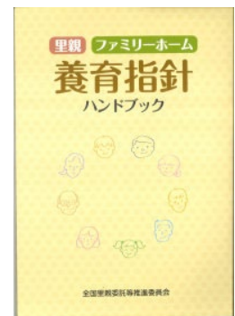
養育指針 ハンドブック 600円